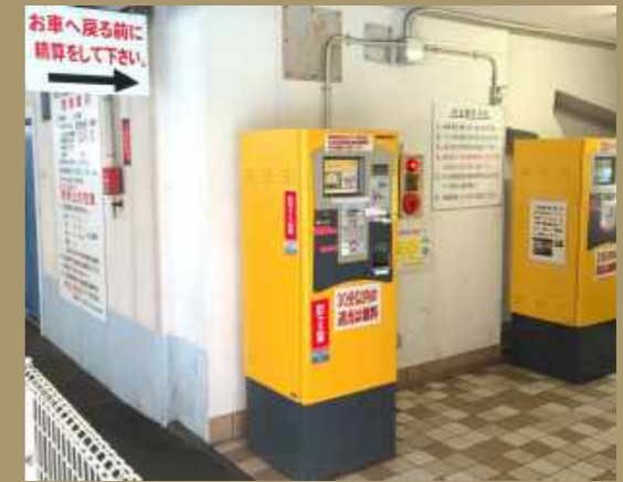
エレベーター前精算機